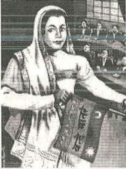
Madame Bhikaiji Rustom Cama

The arena of the great struggle for national independence of our country was not confined to the boundaries of India alone. There were many revolutionaries who lived and work abroad, who did their best to attract and form world opinion in favour of the independence movement of India. These revolutionaries abroad had provided arms and other assistance to their colleagues in India, rendered political and diplomatic help, published and circulated revolutionary literature, trained many revolutionaries in use of arms and other violent matters.